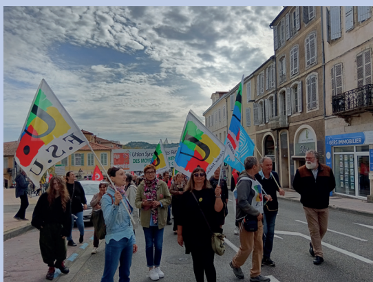
Auch, le 1er octobre pour les salaires, les retraites et les conditions de travail