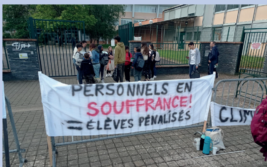
Mobilisation du collège Jean Monnet à Castres le 16 septembre