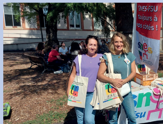
Accueil des stagiaires par le secteur Stagiaires du SNES-FSU lors de la pré-rentrée

La "clarification" qui devait sortir des élections législatives anticipées, provoquées par un noyau des plus réduits de reclus à l'Élysée, a finalement bien eu lieu : E. Macron entend conduire, "quoi qu'il en coûte" au pays et à ses citoyen-nes, notamment ceux qui ont tant besoin des Services publics, les politiques qu'il a mises en oeuvre depuis 7 ans, pourtant clairement et majoritairement rejetées par les deux élections de juin.